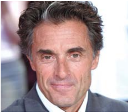
Gérard Holtz , présentateur TV sur France Télévisions