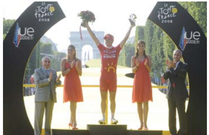
Sylvain Chavanel, élu Super Combatif 2008