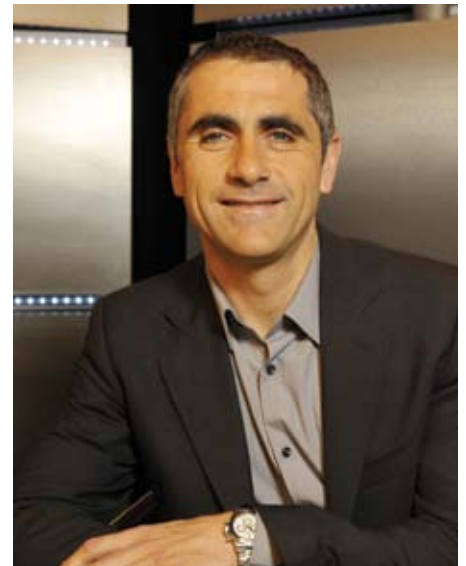
Laurent Jalabert , ancien coureur professionnel, consultant pour France Télévisions et RTL, membre du Jury

« Ce prix est une superbe invention. Pour moi, c'est un vrai grand plaisir chaque année de recevoir les Combatifs dans mon «Vélo club» et dans l'émission d'après Tour parce que la plupart du temps, ce sont des gens qui ont du caractère et de la personnalité. »