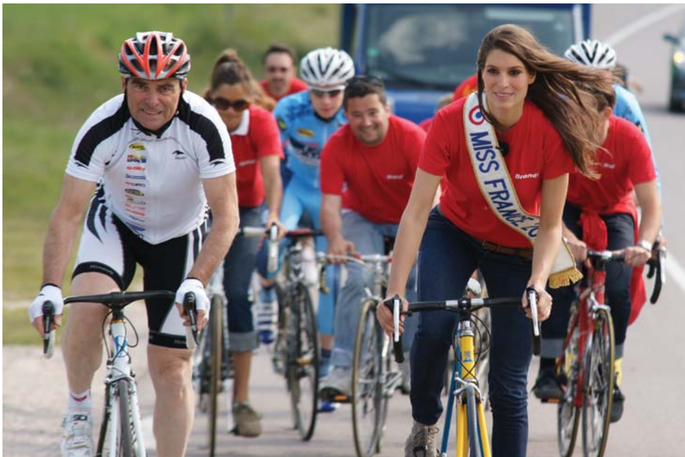
Laury Thilleman et la légende du Tour Bernard Hinault au coude à coude sur les routes de la 5 ème étape Carhaix-Cap Fréhel

Après une séance photos sur le parcours et un rafraîchissement au Fort La Hatte, le convoi, invité par le Conseil Général, a assisté au cocktail de présentation du Tour de France dans les Côtes d'Armor, avant de dîner et de retrouver Paris le lendemain matin.