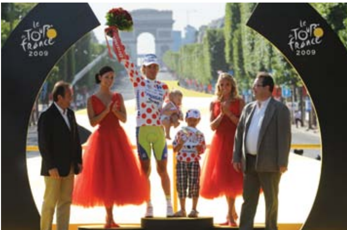
Franco Pellizotti, vainqueur du Prix Brandt en 2009