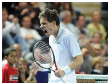
Nicolas Mahut , joueur de tennis français qui a joué le plus long match de l'histoire du tennis (70-68 au 5 ème set face à Isner)

« La combativité est le maître-mot de chaque sportif. C'est un état d'esprit, avoir la force de ne jamais baisser les bras. Contre J. Isner à Wimbledon l'an dernier, j'ai tout donné, peut-être même plus que ce que j'étais capable de faire. »