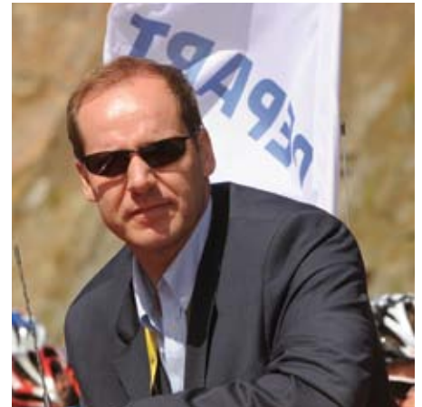
C.Prudhomme, Directeur du Tour de France

Il « faut y aller », il faut oser, attaquer, être disponible, croire en soi et en l’équipe. Il faut des qualités de volonté, d’abnégation, qui sont nécessaires dans la vie et que Brandt porte haut. Il y a une sorte d’évidence entre les qualités nécessaires pour le coureur cycliste à remporter ce trophée et ce qui est nécessaire aussi au quotidien dans la vie des salariés de Brandt pour faire progresser leur entreprise.