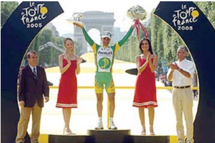
Oscar Pereiro, Super Combatif 2005